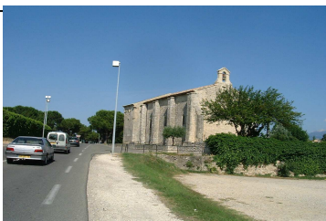
Chapelle St Quentin