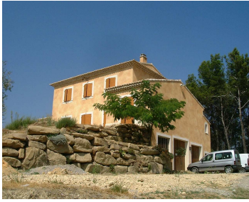
«les caudalies »